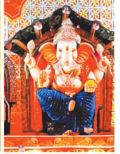
टीपी नगर में विराजित विघ्नहर्ता।