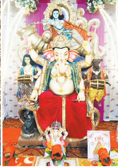
आरपी नगर फेस-1 में विराजे गणपति।