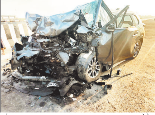
दुर्घटनाग्रस्त कार। (फाइल फोटो)

जिले में सड़क दुर्घटनाओं को रोकने के लिए पुलिस लगातार तरह तरह के जागरूकता अभियान चला रही है जिसका असर अब सामने आने लगे हैं। पिछले वर्ष की तुलना इस वर्ष सड़क हादसों का ग्राफ लगभग बराबर चल रहा है। पुलिस बचे चार महीनों में इस हादसे के ग्राफ को कम करने का भरपूर प्रयास करेगा।