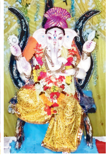
शिवाजी नगर में विराजित हुए गणपति।