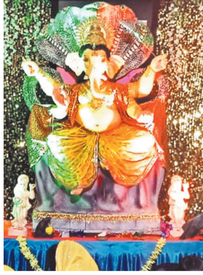
वार्ड क्रमांक 38 लालघाट में विराजित बप्पा।