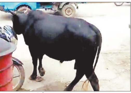
आतंक मचाने वाला मवेशी।

इन दिनों शहर में एक काले सांड का आतंक जारी है, जो सप्तदेव मंदिर से पुराने बस स्टैंड के बीच घूम रहा है। जिससे आने-जाने वाले लोग आतंकित हैं, यह सांड अब तक कई लोगों पर हमला कर घायल कर चुका है। इसकी जानकारी निगम के जिम्मेदार अफसरों को देते हुए आतंक का पर्याय बनने इस सांड को पकड़कर गोठान ले जाने की मांग की गई है लेकिन इसे अब तक निगम द्वारा काउन्सेलर टीम को भेजकर नहीं पकड़ा गया है और वह खुलेआम घूम रहा है, जिससे