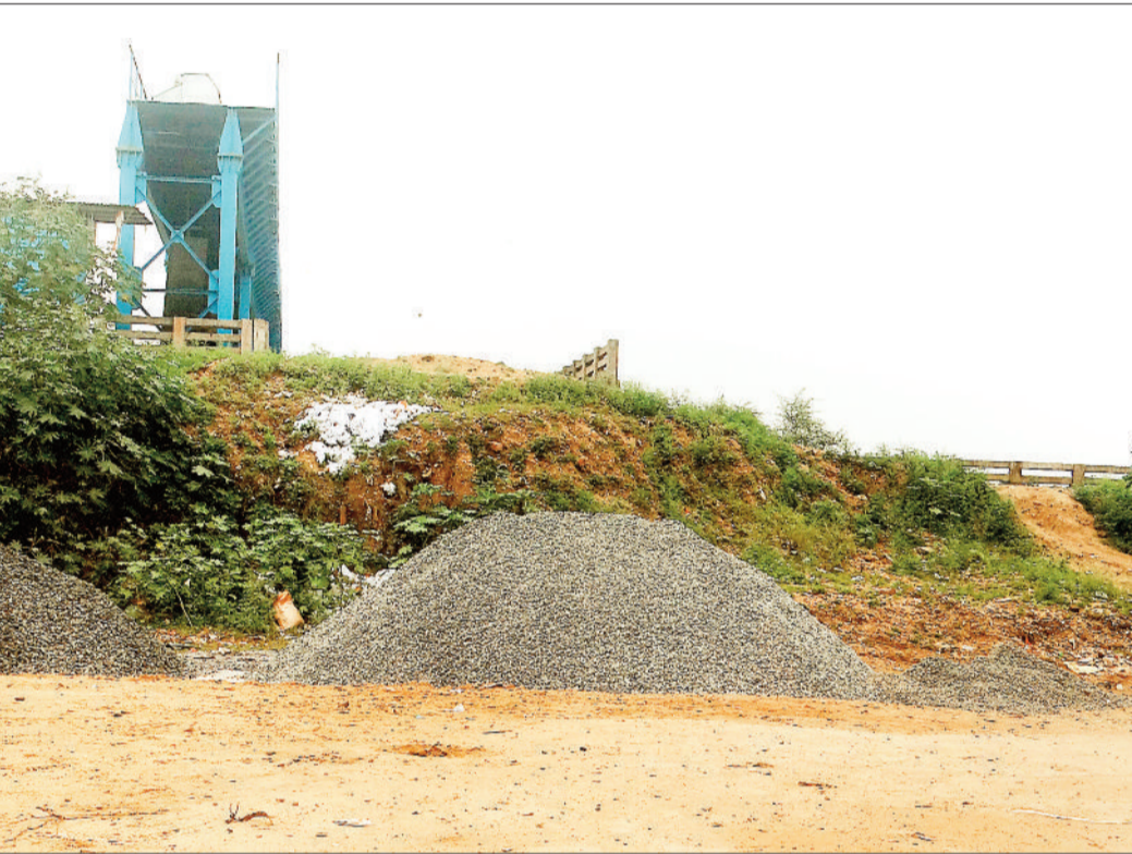
पचरीघाट बैराज का निर्माण कार्य अंतिम चरण में।

पचरीघाट बैराज का निर्माण अब अपने अंतिम चरणों में है। सिंचाई विभाग द्वारा बैराज के ऊपर से पुल की तरह ही आवागमन के लिए रास्ता बनाया गया है। इसके अंतर्गत शनिचरी रफटा की ओर से बैराज पर चढ़ते समय तो चढ़ाई संतुलित है, लेकिन पचरीघाट वाले हिस्से में खड़ी चढ़ाई लोगों के लिए समस्या बनी हुई है। पचरीघाट की ओर से बैराज में चढ़ने व उतरने के दौरान वाहनचालकों को लगातार दुर्घटनाग्रस्त होना पड़ रहा है। अरपा नदी पर बारहों महीने जलभराव बनाए रखने के उद्देश्य से शहर में दो स्थानों पर बैराज बनाए जा रहे हैं। शिवघाट पर बैराज बनकर तैयार हो चुका है, वहीं पचरीघाट बैराज का काम युद्धस्तर पर जारी है। उम्मीद की जा रही है कि साल के अंत तक पचरीघाट बराज भी बनकर तैयार हो जाएगा। बैराज के ऊपर पुल की भांति आवागमन के लिए पर्याप्त जगह है, जहां लोग चांटीडीह से बैराज के ऊपर से होकर सीधे जूना बिलासपुर पहुंच सकेंगे। इस दौरान चांटीडीह की ओर बैराज में चढ़ने के लिए पर्याप्त ढाल है, जिसमें वाहनचालकों को इस ओर से बैराज में चढ़ने व उतरने में कोई दिक्कत नहीं हो रही है। पचरीघाट वाले हिस्से में खड़ी चढ़ाई है, जिससे बैराज में वाहन लेकर चढ़ना काफी जोखिम भरा है। इधर चांटीडीह की ओर से बराज में चढ़कर पचरीघाट की ओर उतरने वाले कई वाहनचालक तो एकदम खड़ा ढाल देखकर वापस लौट जा रहे हैं। जबकि उतरने का प्रयास करने वाले कई वाहनचालकों को प्रतिदिन दुर्घटनाग्रस्त भी होना पड़ रहा है। इस संबंध में सिंचाई विभाग द्वारा भी पचरीघाट की ओर चढ़ाई अधिक होने, लेकिन ढाल देने के लिए वहां अधिक स्थान नहीं होने की बात स्वीकार की गई है।