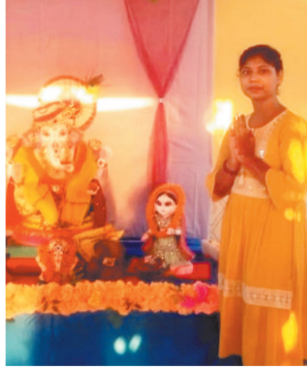
इमलीडुमू में विराजित गणपति बप्पा।